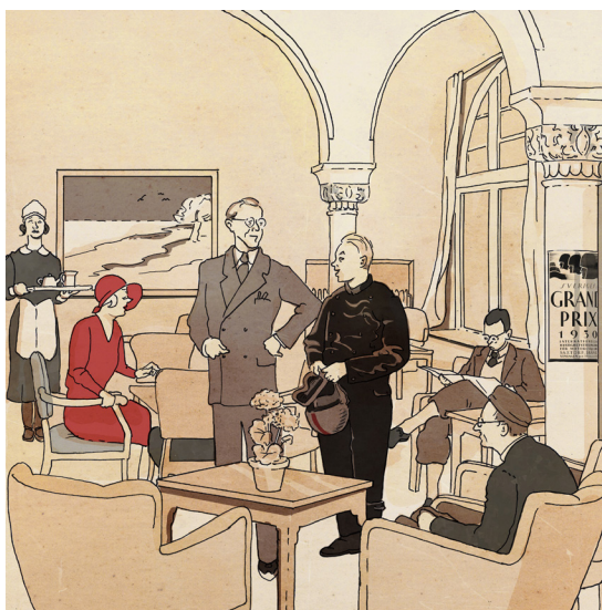
30-talets café, med Sven Jerring på plats.