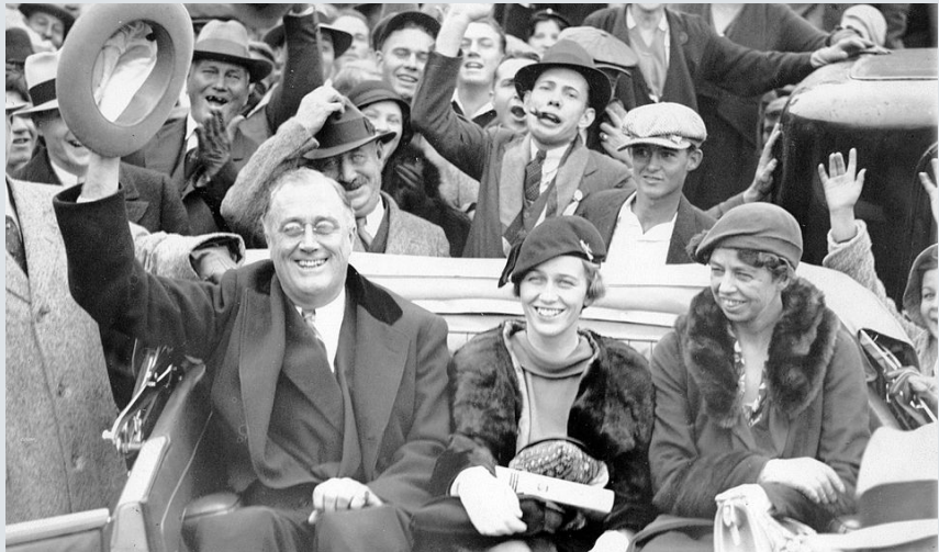
Franklin D Roosevelt kampanjade 1932 under parollen "Happy days are here again".

Vi i styrelsen hoppas att våra Grandiosa medlemmar finner programmet aptitligt och att det kan motverka dystra tankar och